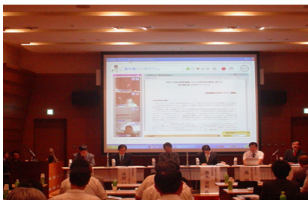
平成18年9月19日「著作権シンポジウム」