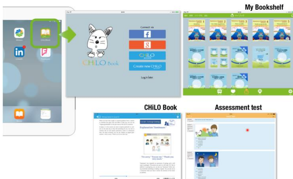
図2 CHiLO Reader イメージ図